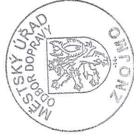
Bc. Ivana Z Í T K O V Á

Proti stanovení místní úpravy provozu formou opatření obecné povahy nelze podat opravný prostředek (§ 173 odst. 2 zák.č. 500/2004 Sb.).