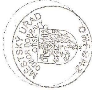
Bc. Ivana Zítková

Stavba nesmí být zahájena, dokud stavební povolení nenabude právní moci. Stavební povolení pozbývá platnosti, jestliže stavba nebyla zahájena do 2 let ode dne, kdy nabylo právní moci.